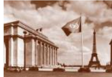
Palais de Chaillot, Paris, Siège de l'ONU en 1948

Manifestations françaises pour la célébration du 60ème anniversaire de l'ONU