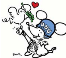
Dessin de Plantu présenté à l'exposition « Traits libres », organisée pour le 60 ème anniversaire de l'ONU à Paris